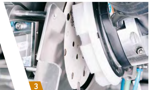
3 Abreißen des benutzten Schleifmittels