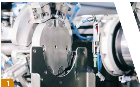
1 Automatischer Schleifmittelwechsel