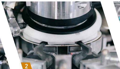
2 Fixierung des Schleifmittels