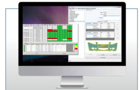
Einfache Statistik und Prozessauswertung