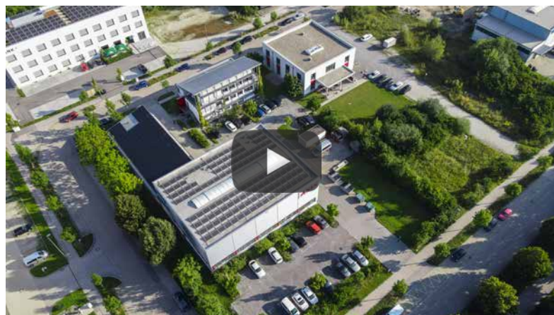
ASIS Stammsitz Landshut