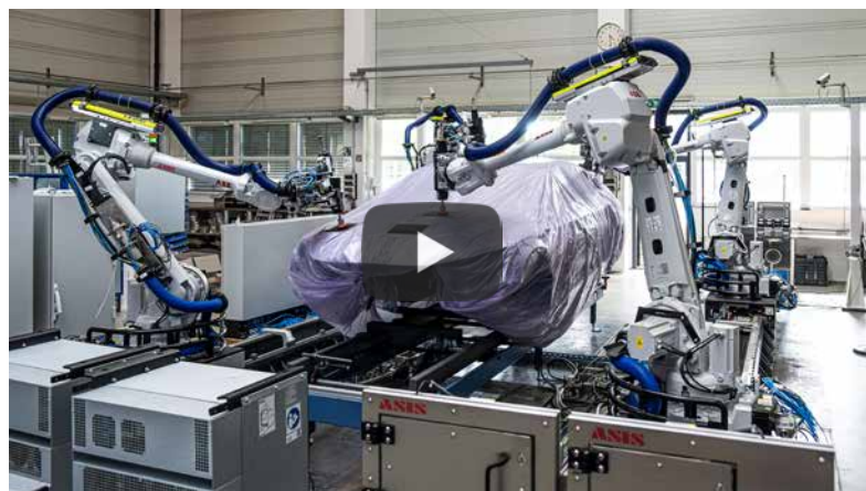
Anlage zum automatischen Finish (Automotive)