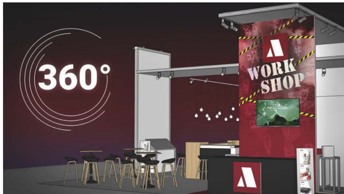
Leistung, Kooperation, Service und Nachhaltigkeit bestimmen laut ASIS das 360-Grad-Programm des Unternehmens auf der diesjährigen PaintExpo

Ein geschärftes Leistungsspektrum, Kooperationen mit Partnerunternehmen, ein neues Service Portfolio und nachhaltige Produkte zeigt ASIS in Karlsruhe.